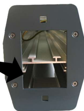
Embase pour faux-plancher